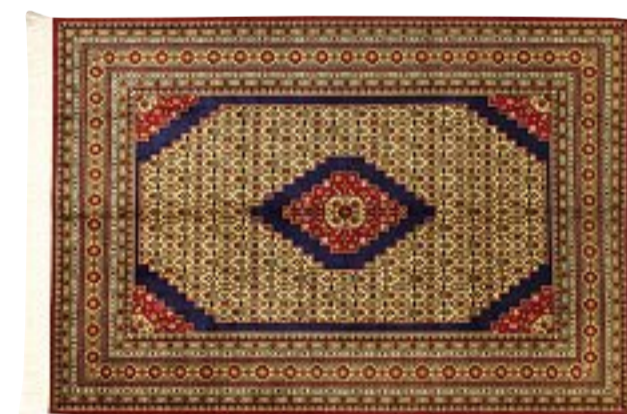
SHIRWAN AZERBAIJAN 295x200 cm c.a. € 5.500,00 -50% € 2.750,00