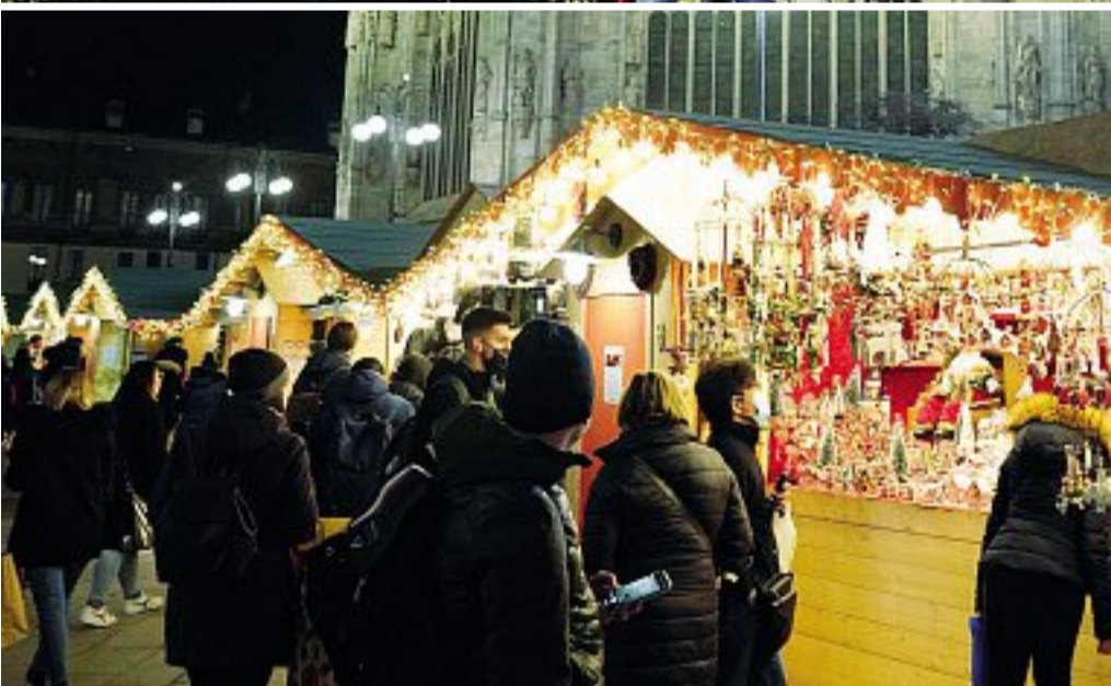
Allestito La preparazione dell'albero di Natale in piazza del Duomo e il tradizionale mercatino attorno alla cattedrale

Abeti, luci e mercatini Il segno della tradizione nell'attesa delle feste