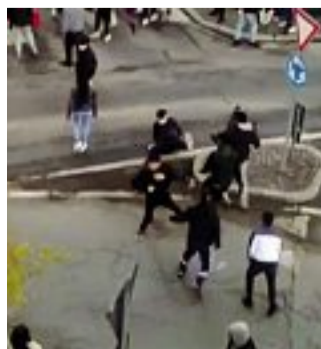
Le sfide Scontri tra giovani a Gallarate

«Io mio figlio ormai non lo gestisco più». La resa del padre di uno dei ragazzini protagonisti dell'ennesima inchiesta sulla delinquenza minorile in provincia di Varese. A completamento delle indagini dei carabinieri del Comando provinciale e della locale Compagnia, il Tribunale dei minori