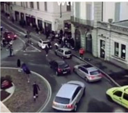
Gli episodi Fotogrammi tratti dai filmati investigativi di una maxi-rissa tra minorenni a Gallarate, in provincia di Varese

dei provvedimenti giudiziari segnerà per sempre le esistenze dei minorenni, resta una domanda senza al momento una risposta. Il gip, nella stesura del provvedimento, ha sottolineato le condotte violente e «la sistematicità dell'attività» e «le azioni delittuose» di ragazzini «che hanno palesato di aver posto in essere, nella stessa giornata, plurime condotte di rapina ai danni di soggetti diversi». La scelta della comunità anziché del carcere, si ispira però a un ragionevole ottimismo della magistratura affinché, in considerazione della giovane età, qualcosa se non tutto si possa ancora salvare, sempre che vi sia, da parte dei diretti interessati, l'accettazione dell'autorità. In analoghi casi a Milano, nella zona della Darsena, i carabinieri hanno raccontato della frequenza con la quale, quando accorrono per sedare una rissa oppure un lancio indiscriminato di bottiglie di vetro contro obiettivi occasionali (le vetrine di un negozio come un tram, ignari passanti come i rider in attesa fuori dai ristoranti), i violenti non si fermano. Non lo fanno all'udire in lontananza le sirene delle pattuglie; non lo fanno alla discesa dei carabinieri delle macchine.