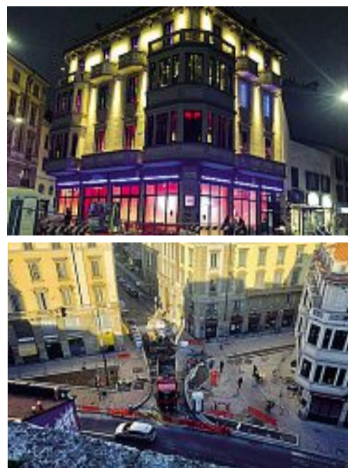
Panoramica Il palazzo con l'illuminazione serale e l'incrocio dall'alto tra via Canonica e via Alfieri