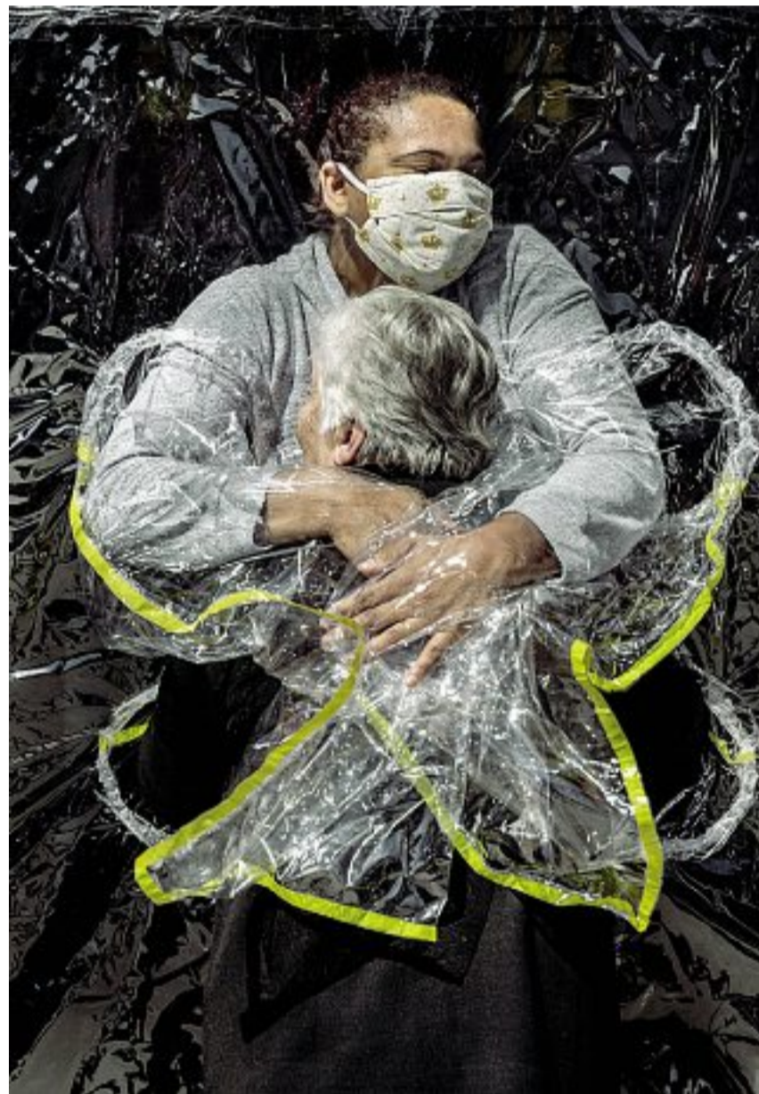
La forza di un abbraccio La foto vincitrice del danese Mads Nissen scattata in un ospedale brasiliano

esima volta consecutiva la mostra del concorso che anche quest'anno tiene fede al suo mandato storico: «Esistiamo per aiutare la comprensione del mondo attraverso la qualità del fotogiornalismo». Un fotogiornalismo che, nonostante le difficoltà di questi anni, rimane comunque vivo e propositivo. I 45 autori premiati ci permettono di «vedere quello che accade nel mondo», di conoscere situazioni lontane, di essere testimoni di eventi che solo la fotografia consente di raccontare. La selezione del 2021 mette in relazione linguaggi collaudati, documentari, e interpretazioni personali, offrendoci una casistica ampia delle tendenze del fotogiornalismo contemporaneo internazionale. I due premi più importanti, la foto e la storia dell'anno, sono stati attribuiti rispettivamente al fotografo danese Mads Nissen, autore di un'immagine che ritrae, durante la pandemia, un'anziana signora abbracciata dalla sua infermiera in una casa di cura brasiliana, e ad Antonio Faccilongo per «Ha-