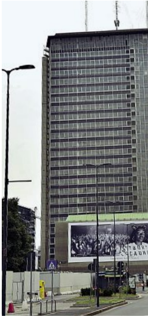
Simbolo L'ex palazzo comunale di via Pirelli 39 detto Pirellino, acquistato da Coima in un'asta record da 193 milioni di euro

Ecco il punto politico. Nella maggioranza c'è chi ritiene che la delibera debba escludere oltre al centro anche le zone semicentrali per premiare invece chi intende investire in periferia e riqualificare i veri buchi neri della città. Lo dice apertamente il Verde, Carlo Monguzzi: «Il bonus era stato pensato per i buchi neri delle periferie dove pochi vogliono investire. Chiediamo al Comune un ultimo sforzo: togliere dai bonus il recupero del Pirellino di via Gioia, proposto peraltro da un'impre-