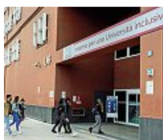
Università Gli studenti della Bicocca

Patto tra Atenei per una didattica inclusiva