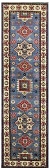
KAZAK 300x80 cm c.a. € 1.300,00 -60% € 520,00