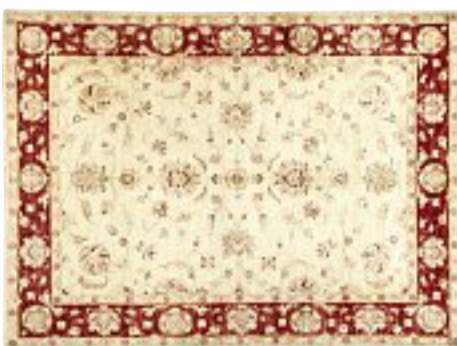
FERAHAN 240x170 cm c.a. € 3.300,00 -50% € 1.650,00