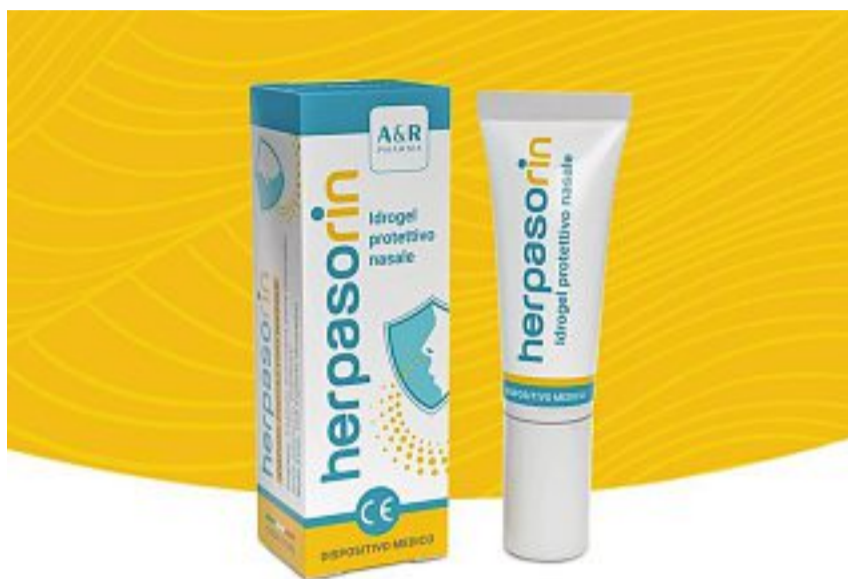
Il prodotto Herpasorin difende le mucose nasali

L'infiammazione del naso può essere provocata dall'istamina, rilasciata dall'organismo in caso di allergia, così come da batteri e virus.