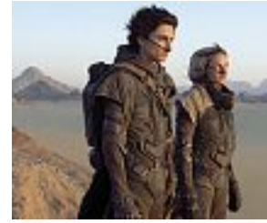
Ultimo nato Il «Dune» di Villeneuve

l'ultimo nato, il «Dune» adrenalinico presentato all'ultima Mostra di Venezia, e firmato da Denis Villeneuve. Alle 19 è il turno del recuperato «Jodorowsky's Dune» (edizione originale, sottotitoli italiani, 2013) di Frank Pavich, che documenta l'odissea produttiva dell'idea di Jodorowsky di realizzare una