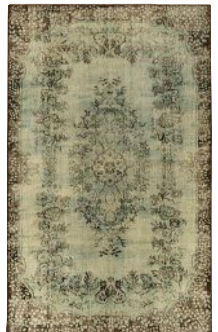
VINTAGE 300x200 cm c.a. € 4.000,00 -70% € 1.200,00

MILANO: P.ZZA ERNESTO DE ANGELI, 7 (INTERNO CORTILE) TEL. 02 4986131 RESCALDINA (MI): VIA SARONNESE, 27 - TEL. 0331 547771