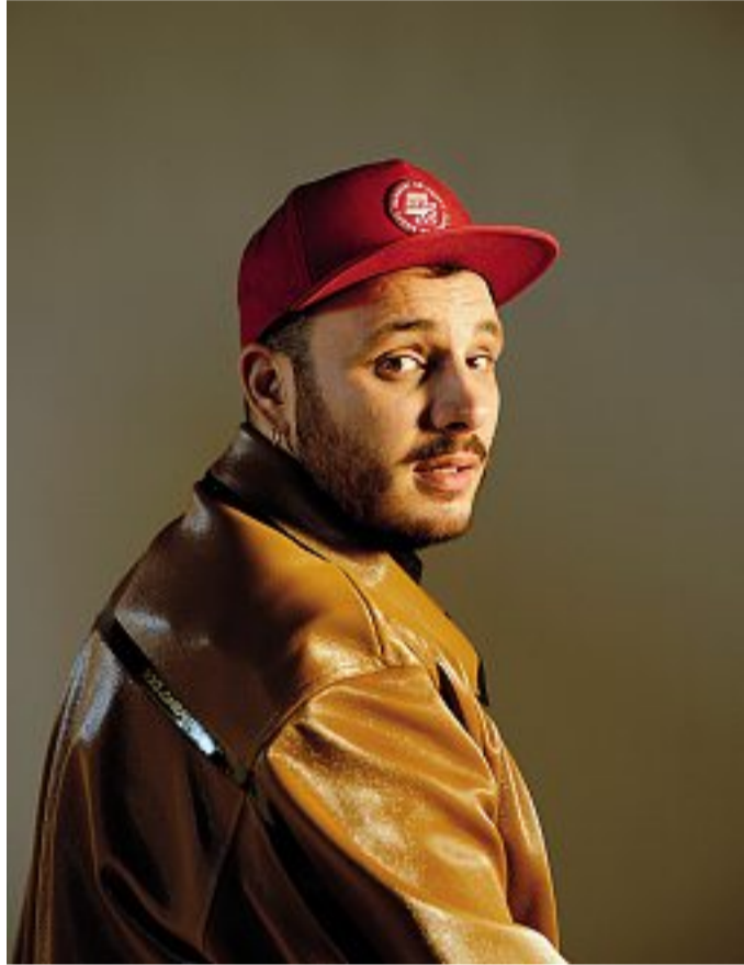
Tra pop e rap Wrongonyou, 31 anni. Trasferitosi da Roma, ora vive al Giambellino

«Mi immaginavo Milano come «la City» e nient'altro, stando qui ho scoperto che ogni quartiere è un piccolo paese. Ora vivo al Giambellino,